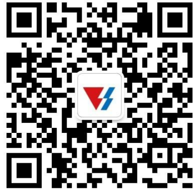
天能校园招聘“微信公众号”